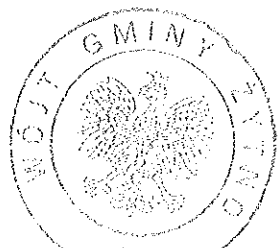
..... okrągła pieczęć Wójta Gminy

Zarządzenie wchodzi w życie z dniem podpisania.